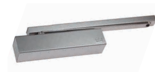
Abbildungen: Türschließer Geze TS 5000 / Dorma TS 93