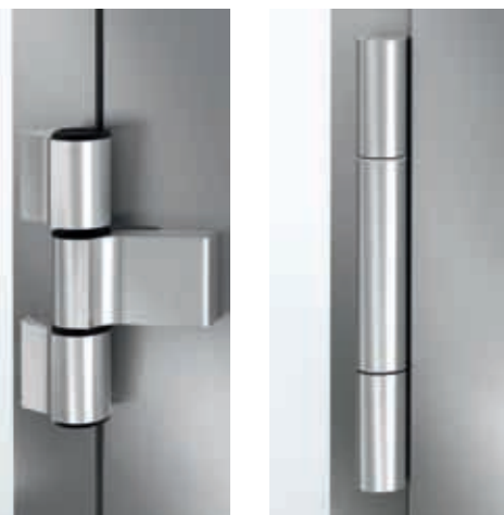
Abbildungen: 3-teiliges Aufsatzband / Rollenband