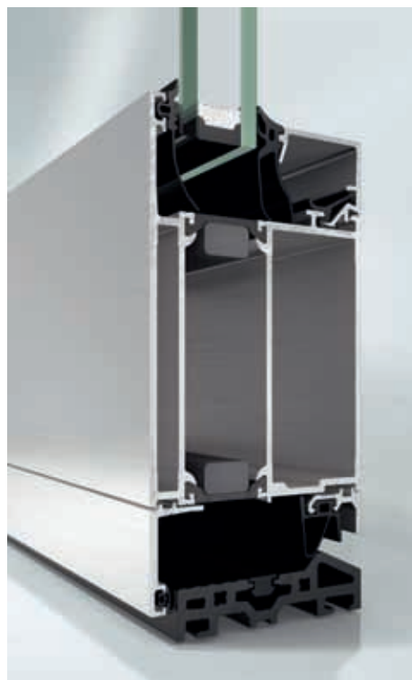
Abbildung: SCHÜCO ADS 75 HD.HI

Alle Türbänder sind nach DIN EN 12400 mit 1.000.000 Schließzyklen auf Dauerbelastung geprüft und können Flügelgewichte von 120 - 200 kg problemlos tragen.